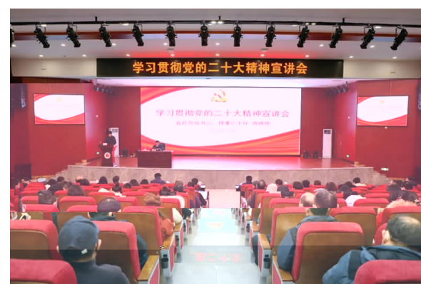
11月30 省 讲 精神 晓 来 湖南 精

务 好 往 务 沟通桥梁 注 呼 解 困难 依法 达 诉 据悉 2021年 案 涉 均 相 收 22 利 施 收 案 也将 部 牵 研 10 案 也将 逐 答 (通讯 易婧 摄影 欣